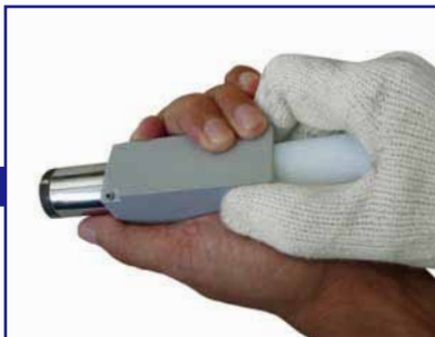
押し出し治具を使いカセットから磁石を押し出す。