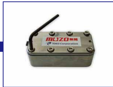
6角レンチでボルトを緩めカバーを外す。