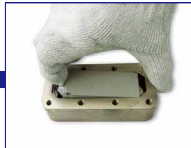
中のカセットから本体を取り出す。